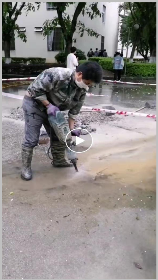
做好水电日常维修和突发抢修工作