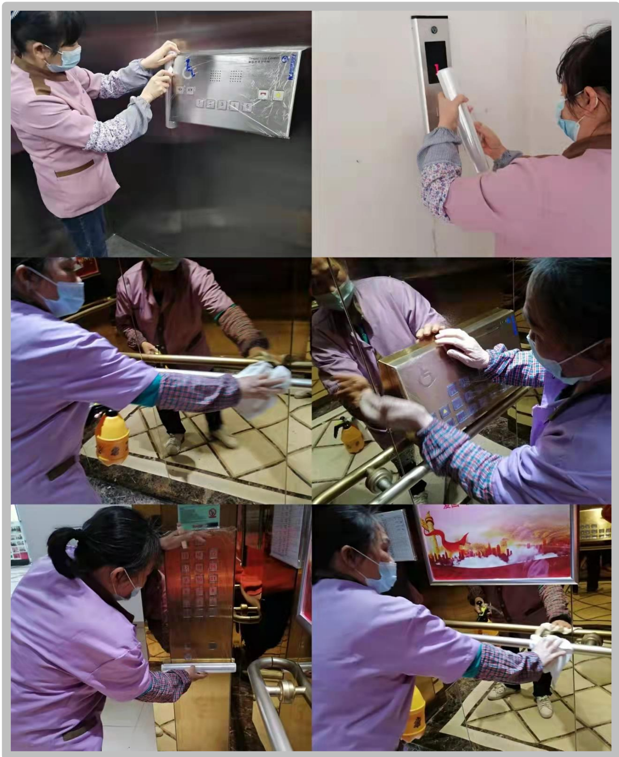
物业对电梯表面进行清洁打蜡、消毒工作