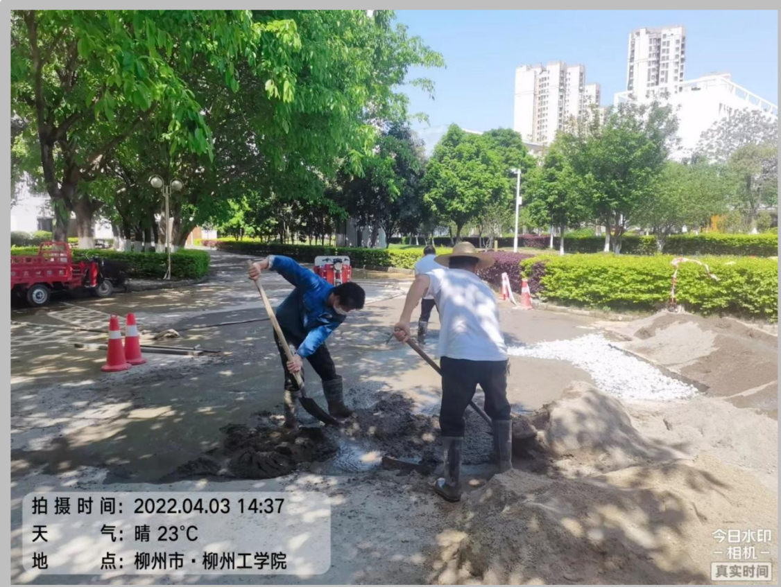
保障师生日常生活，切实做好抢修工作