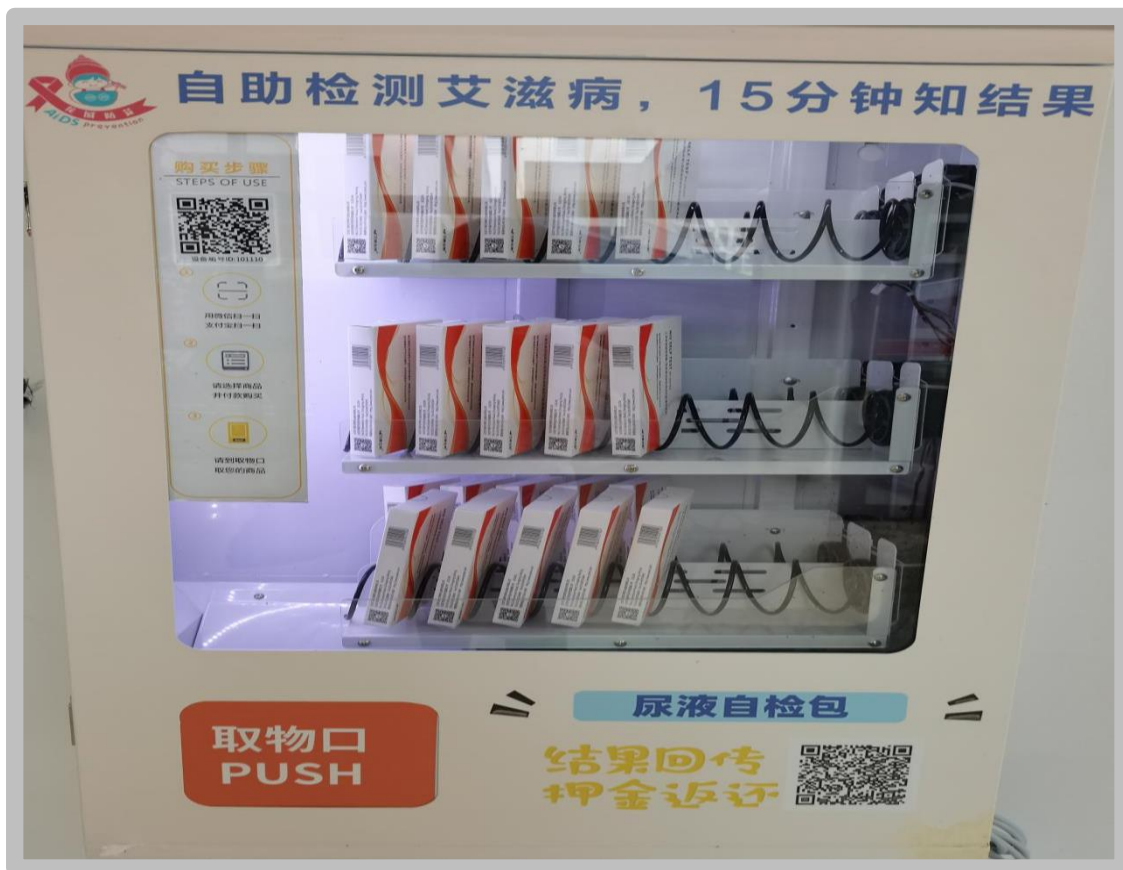
艾滋病自助检测机已开始启用