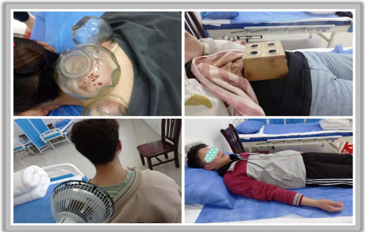
卫生所开展针灸、拔罐、艾灸、远红外线治疗鼻窦炎、颈椎病、痛经落枕项目等