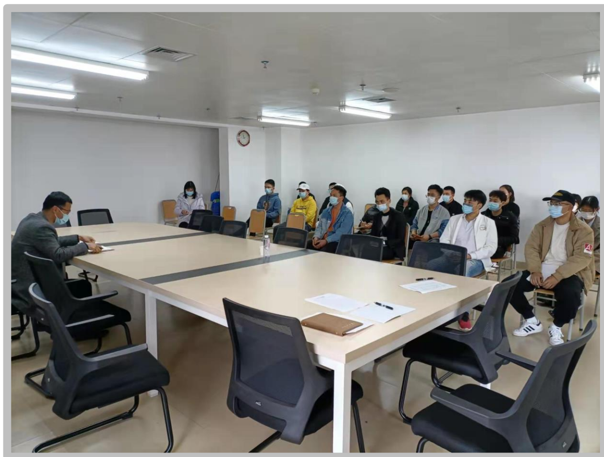
组织学校商贸于3月30日下午在部门大会议室召开疫情防控会

为持续做好常态化疫情防控，坚决巩固来之不易的疫情防控成果，按照上级部门要求，后勤基建部组织学校商贸于3月30日下午在部门大会议室开会，就“壮族三月三”和清明节假期做好疫情防控及消防、水电安全检查等工作进行认真安排和部署。同时，各商贸门面继续实行一米间隔线，做到每日清洁消毒并记录，入口处进行体温检测，多措并举落实防疫措施。