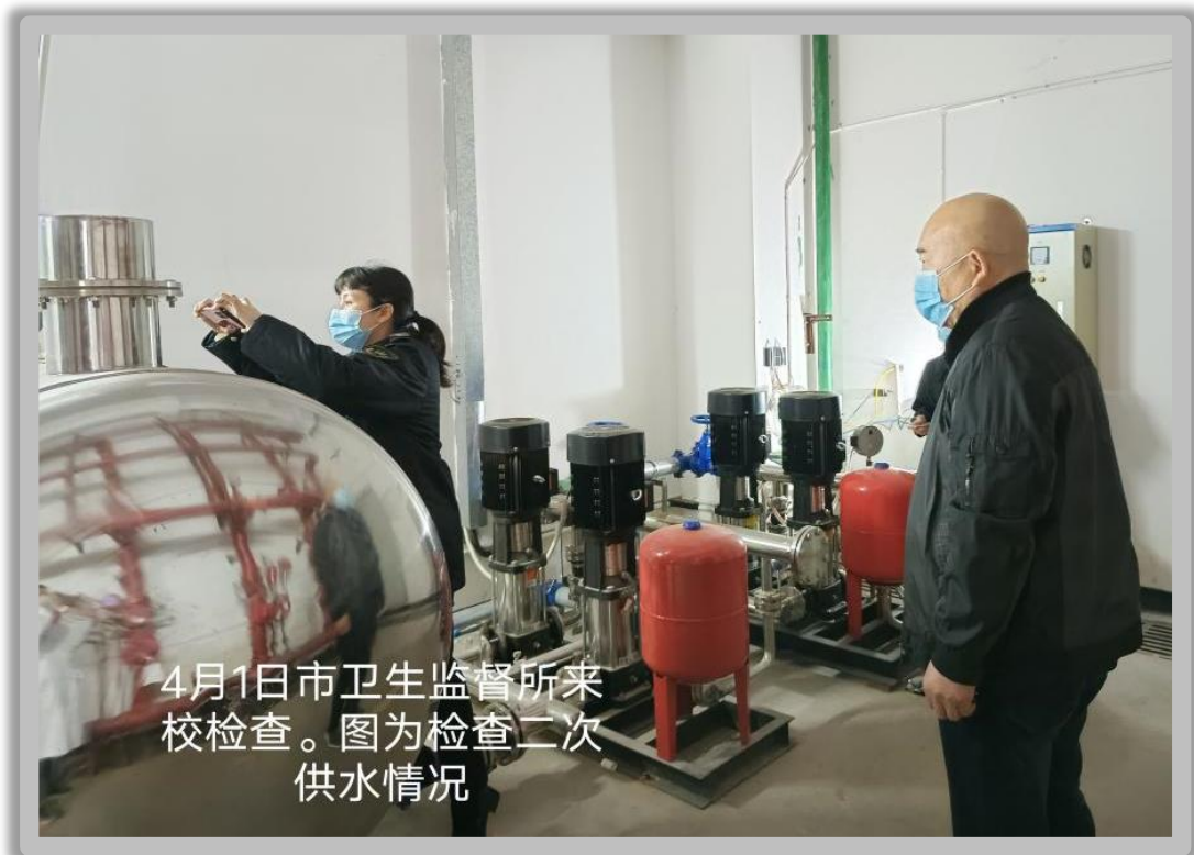
卫生监督所到学校检查