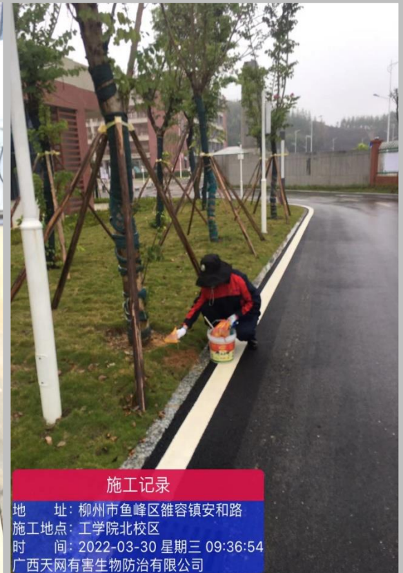
常态化防控白蚁、红火蚁及“四害”