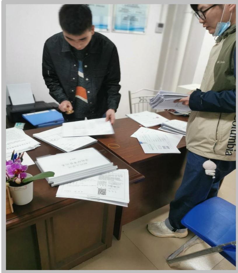
对柳州工学院东门小广场建设项目进行初审