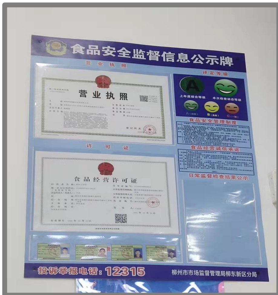
“柳州市餐饮服务量化分级管理A级”荣誉称号

一是食堂每天坚持检查食材运送人员“两码”（健康码和行程码），如14天内离开柳州市内的一律不得进校送货，切实做好常态化疫情防控下餐饮食品安全监管工作。二是为营造“壮族三月三”节日氛围，学校二食堂为师生们提供特色传统美食——五色糯米饭，得到师生一致好评。三是为进一步做好食堂疫情防控工作，保障全体师生身体健康和生命安全，根据疫情防控要求，我校食堂从业人员每周五进行一次核酸检测。四是我校南校区二食堂在柳州市2022年度餐饮服务食品安全监督量化分级管理考核中获“柳州市餐饮服务量化分级管理A级”荣誉称号。