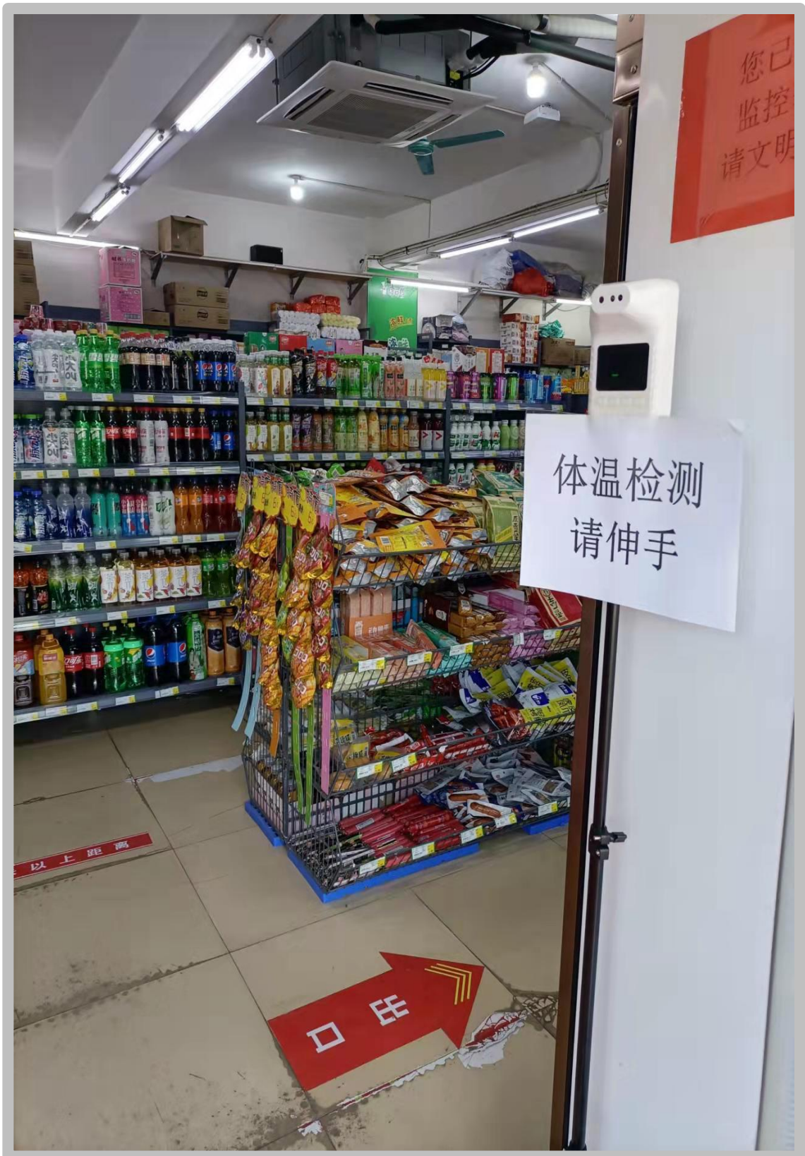
超市入口处进行体温检测