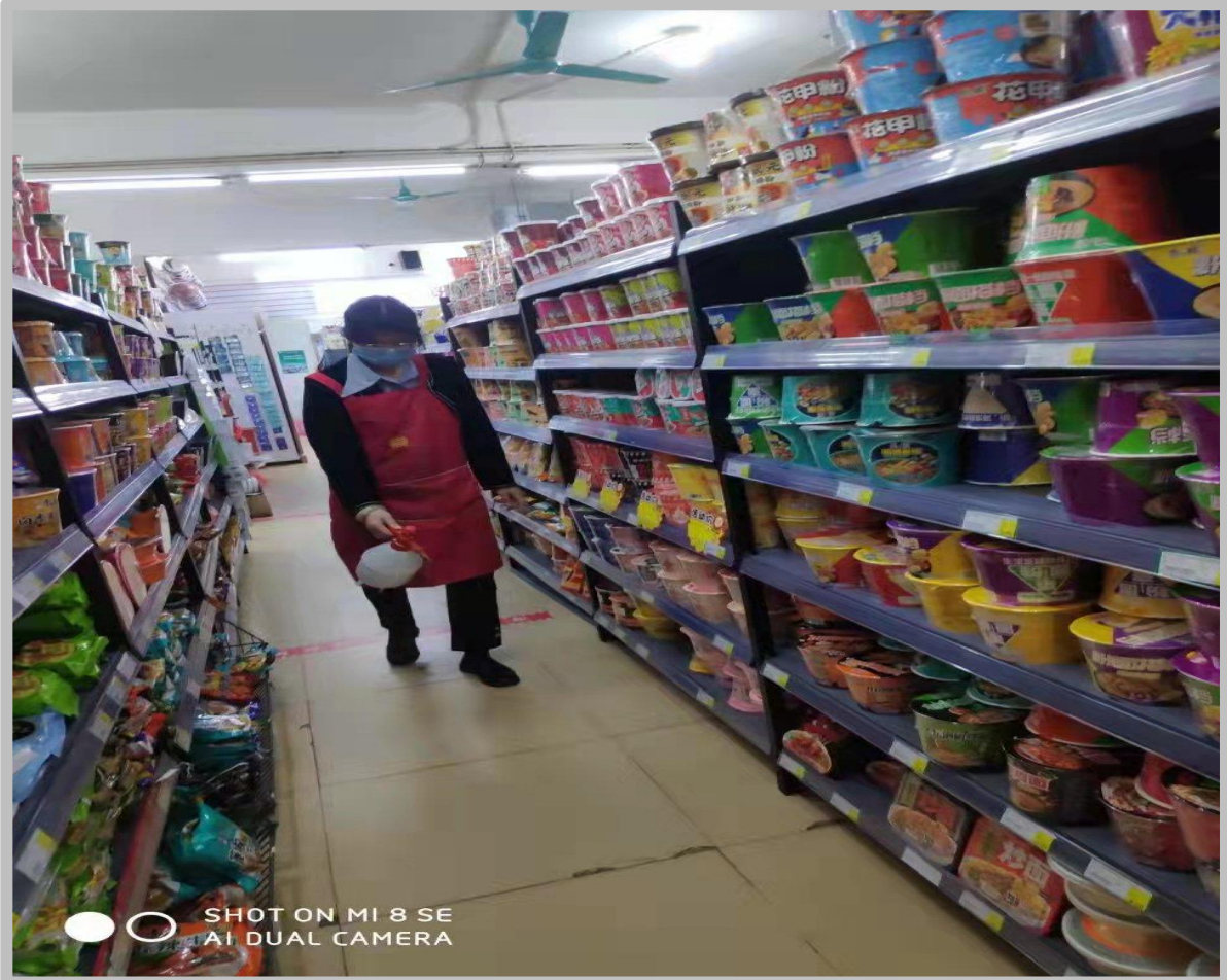
超市日常对场所进行清洁消杀