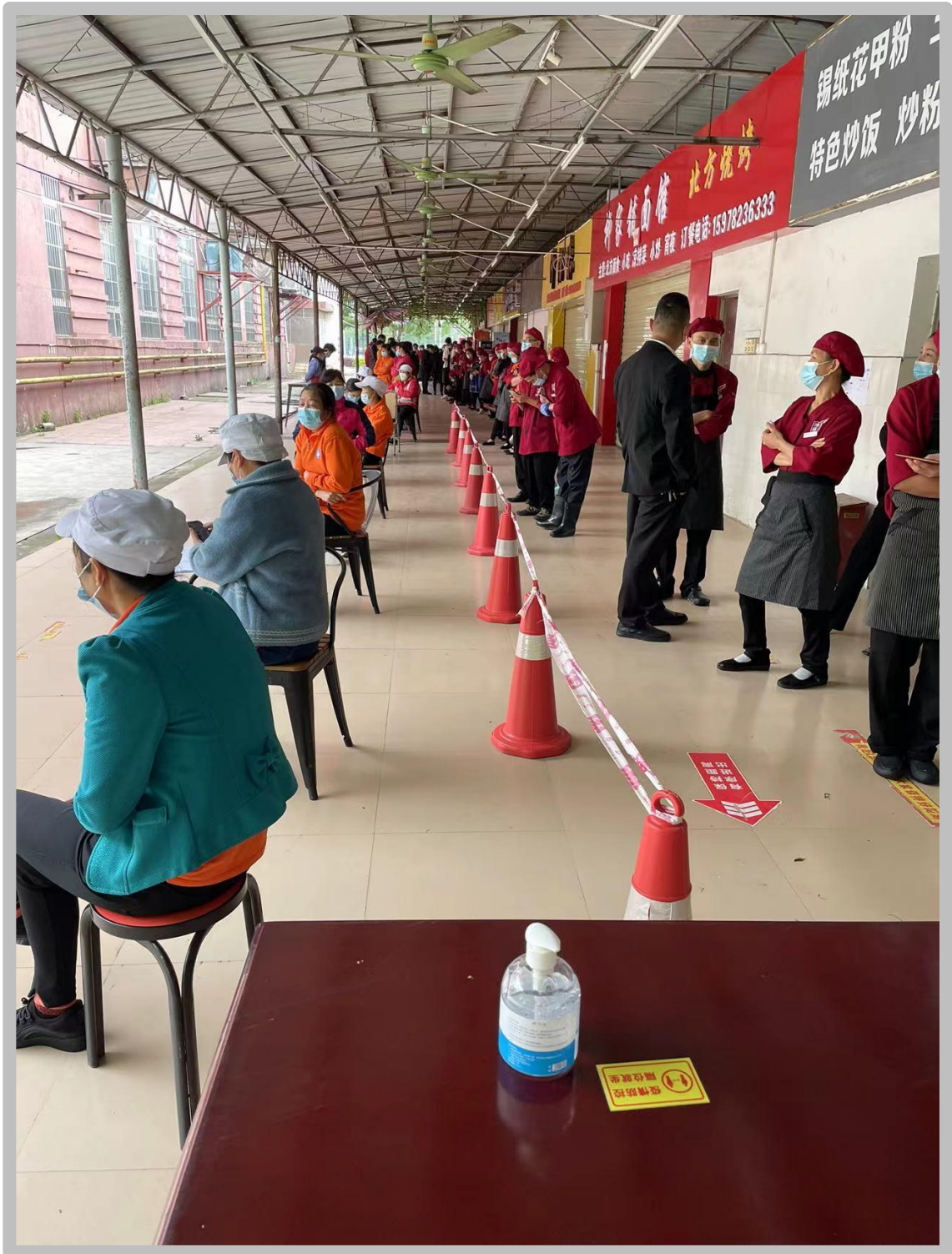
我校食堂从业人员每周五进行核酸检测