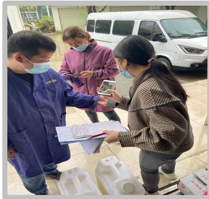
我校食堂每天坚持检查食材运送人员的健康码和行程码