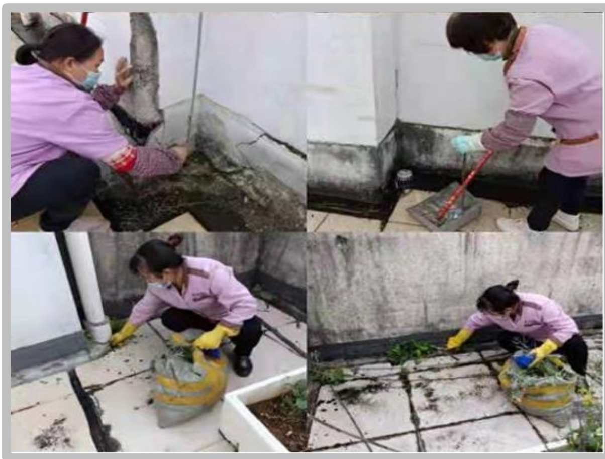
开展排水设施清理工作